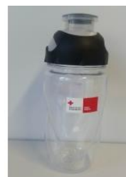
drinkbus € 10,00