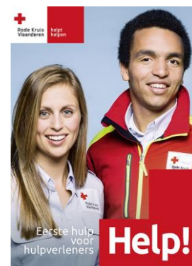
Help! (hulpverleners) € 15,00