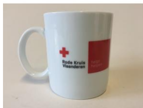
mok € 6,00