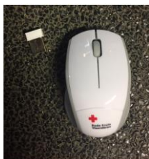
draadloze muis € 12,00