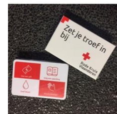
speelkaarten € 6,00