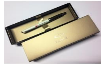
balpen Parker € 12,50