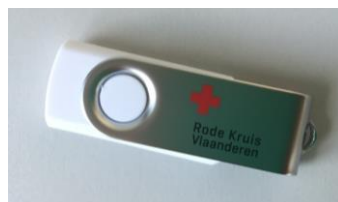
USB stick 4GB € 5,00