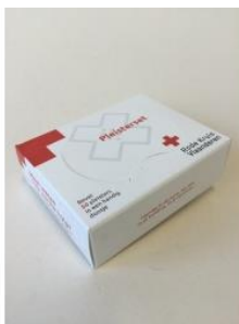
pleisterset 50st € 5,00