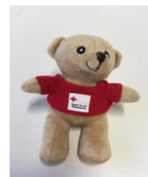
beertje € 6,00