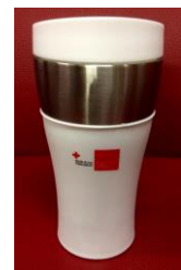
thermomok € 10,00