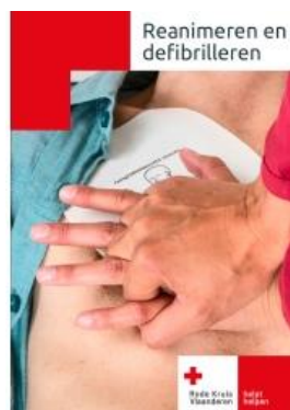
reanimeren & defibrilleren € 6,50