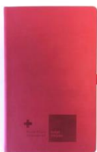
notebook A5 € 10,00