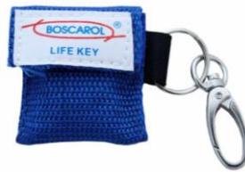
faceshield € 3,00