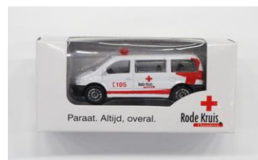
miniaturambulance € 5,00