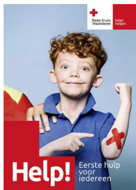
Help! (iedereen) € 25,00