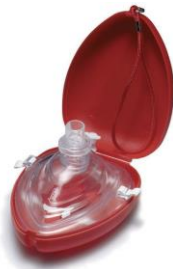
pocket mask € 9,00