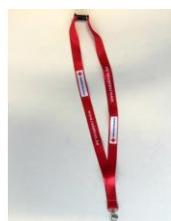
sleutellint € 2,00