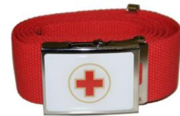
broeksriem € 18,50