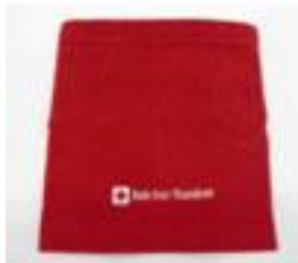
buff in fleecce € 5,00