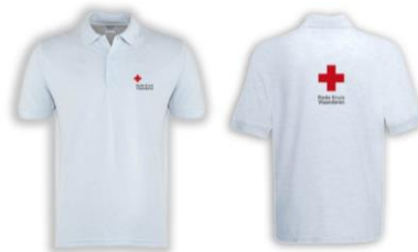
polo € 15,00