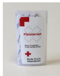
pleisterset 10st € 3,00