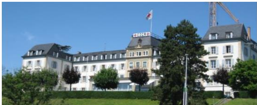
Zetel van het comité in Zurich