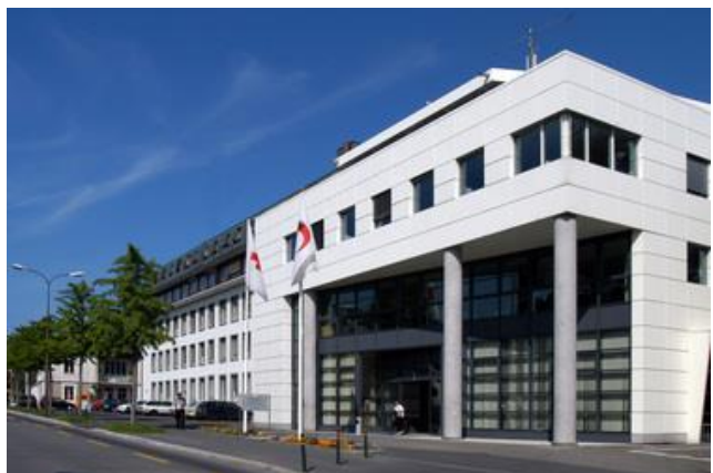
Secretariaat van het IFRC in Genève