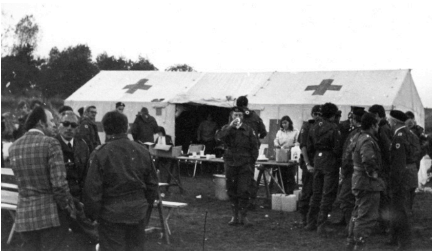
Pauzes ter recuperatie...