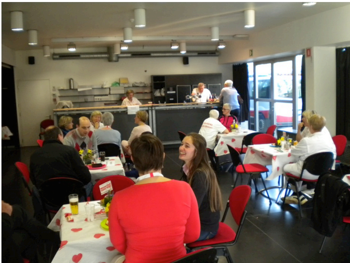
De bar zoals hij er (vóór Corona-tijd) anno 2020 uit ziet.

Waar eertijds het BTC nog voor de drank zorgde, is het nu de taak van de afdeling. Een bijkomend werk dat, met de concessies van levering, zeker niet onbelangrijk is. Het lijkt zo normaal dat de drank er is, maar je krijgt het niet in de schoot geworpen.