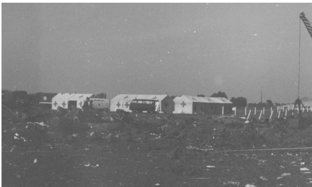
Het terrein van de ramp.

Tot zover dit zeer summier relaas. Hierna nog enkele foto's uit mijn archief over de ramp in Aarsele.