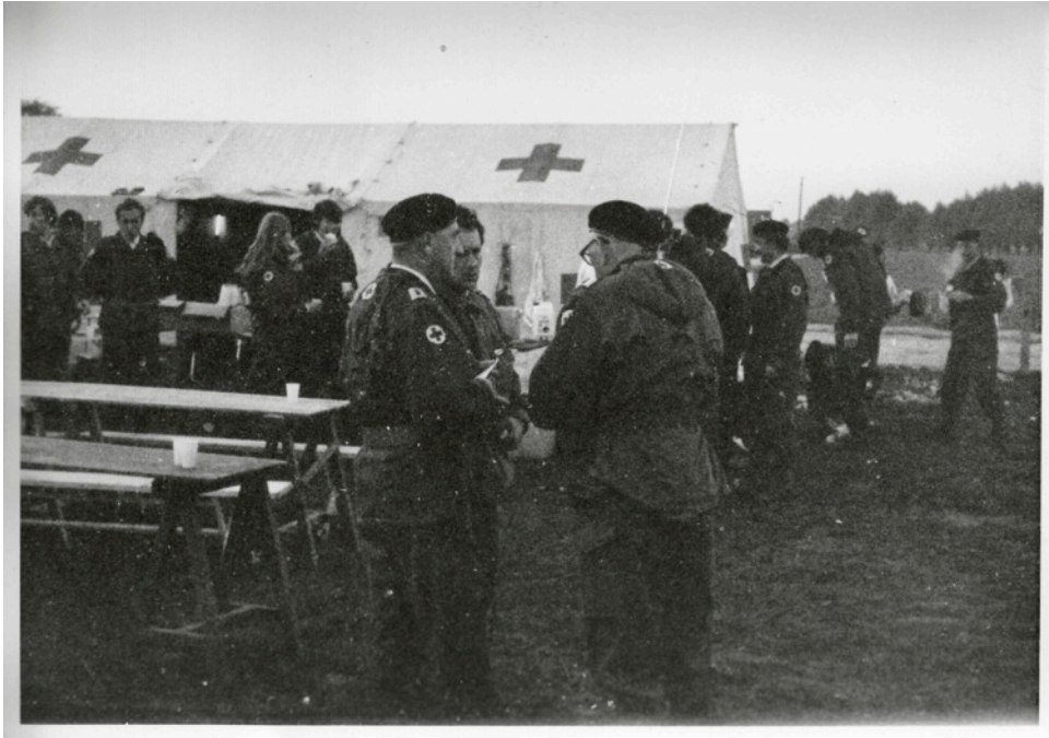
Ook tijdens de pauze werd overlegd over de gang van zaken.