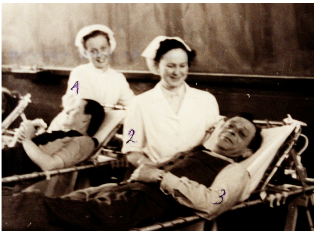
1951 - Bloedinzameling op de Lakenmarkt

Hoe dat het er in de beginjaren aan toeging is ons niet bekend, maar op de foto genomen in 1951 ziet het er naar uit dat het brancards van de afdeling waren, die op schragen waren geplaatst. Dat de plaatselijke afdeling voor de nodige inbreng en logistieke steun instond, lijkt me meer dan logisch. Medewerkers waren toen leden van de 'mobiele colonne' (= Hulpdienst van tegenwoordig).