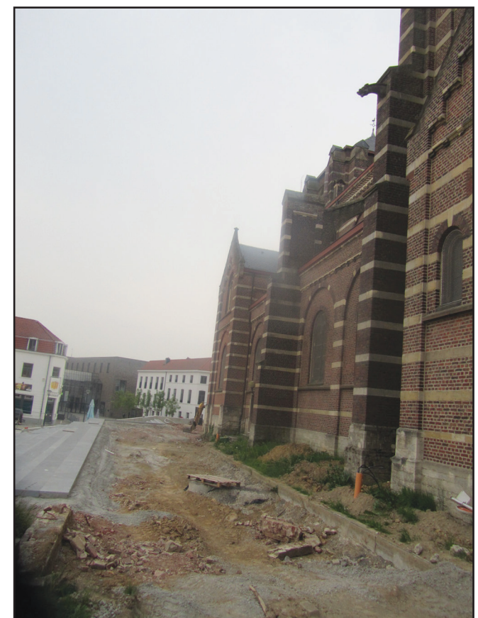
De stabiliteit van de Hoeilaartse kerk kan op dit moment niet meer gegarandeerd worden. Hierdoor is het gebouw tijdelijk gesloten.