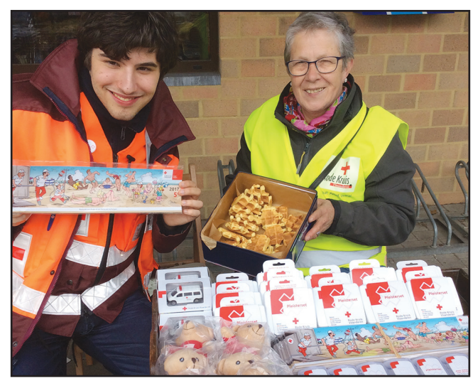
Onze afdeling dankt de bevolking voor hun niet-aflatende steun.■

belangrijkste inkomstenbron voor alle plaatselijke Rode Kruis-afdelingen. De opbrengst gaat dit jaar gebruikt worden voor bij te dragen aan de financiering van de aankoop en onderhoud van hulpmateriaal, de huur van de ziekenwagenstandplaats en opslagruimte, alsook voor de bevolking om hen gratis cursussen aan te kunnen bieden waar-onder EHBO en Helper. De Rode Kruisvrijwilligers van Tervuren werken gratis, maar krijgen een uitgebreide opleiding en volgen regelmatig bijscholingen. Ook daarvoor zal het ingezamelde geld worden aangewend. Personen, organisaties of instituten die graag Rode Kruis-Tervuren sponsoren kunnen steeds contact opnemen met onze afdeling via http://www.rodekruis.be/afdeling/tervuren of een email sturen naar pr@tervuren.rodekruis.be