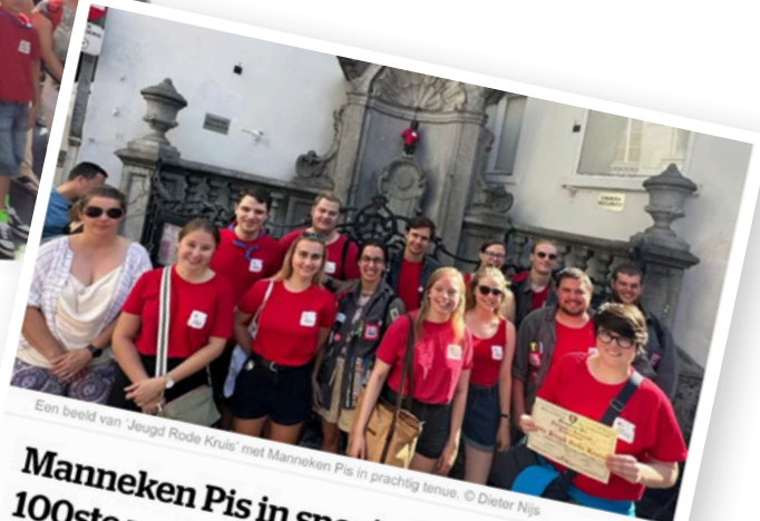
Een beeld van 'Jeugd Rode Kruis' met Manneken Pis in prachtig tenue.

Manneken Pis in speciaal tenue voor 100ste verjaardag van 'Jeugd Rode Kruis'